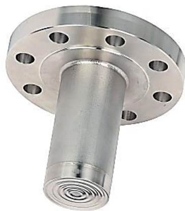
MDS 24系列 - 單法蘭延伸型隔膜