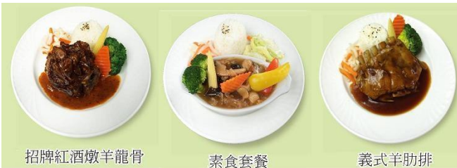
招牌紅酒燉羊龍骨